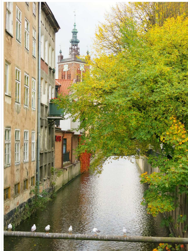
Kanal Ruduni vid Stora Kvarnen