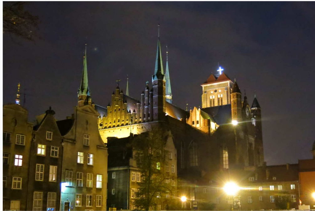
Maria-kyrkan by night. Kyrkan är världens största tegelstenskyrka och som ni ser är det enorm