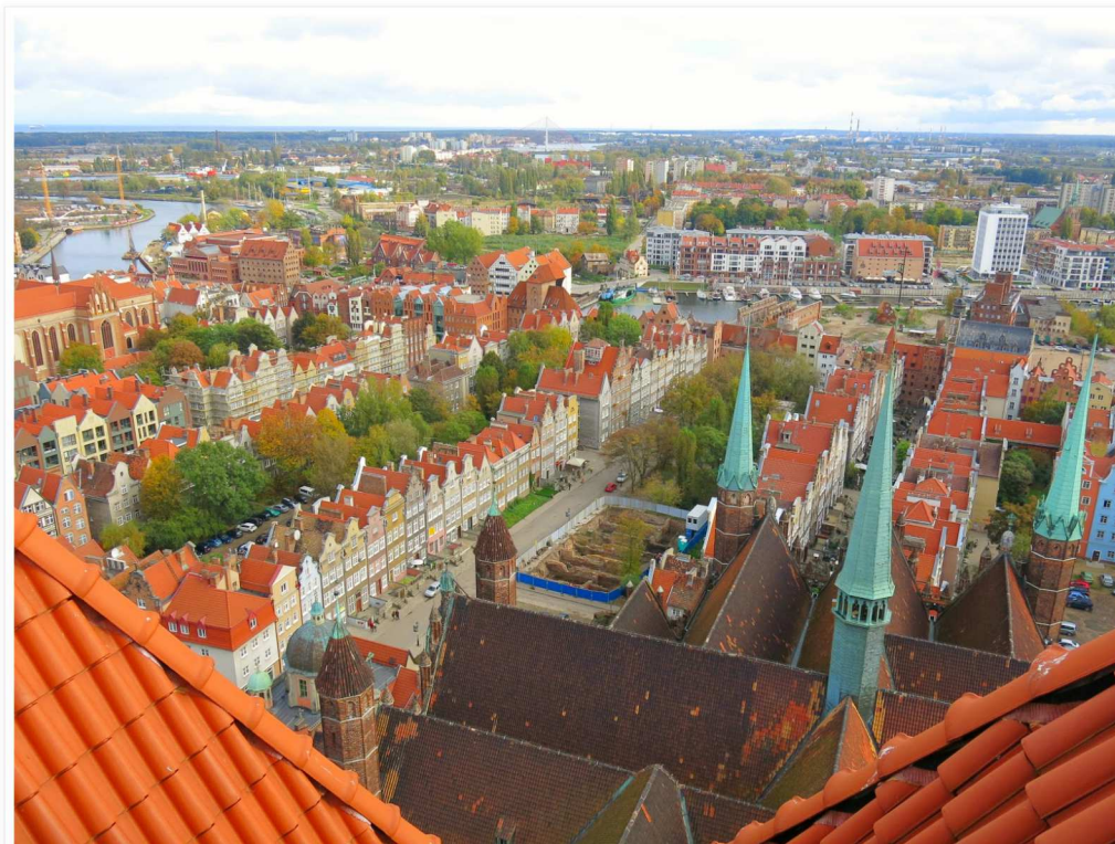
Utsikten från Mariakyrkan. 400 trappsteg upp men värt varje trappsteg