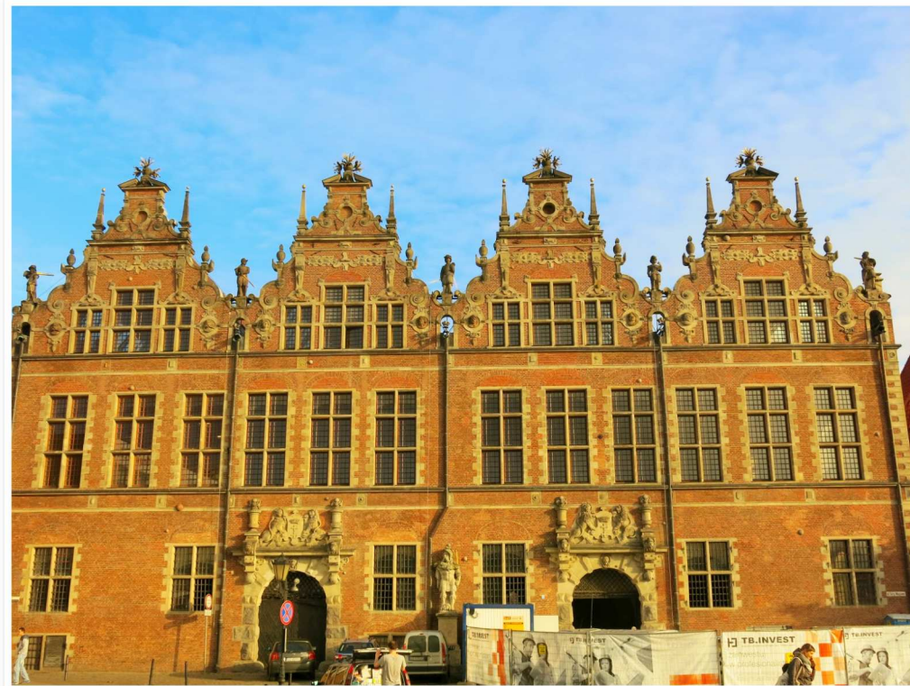
Baksidan av byggnaden The Great Armoury; ingen dålig baksida.