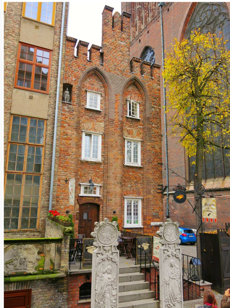
Gdansks äldsta hus. Tyvärr såg jag först när jag skulle gå mot bussen till flygplatsen att det också är möjligt att gå in i huset