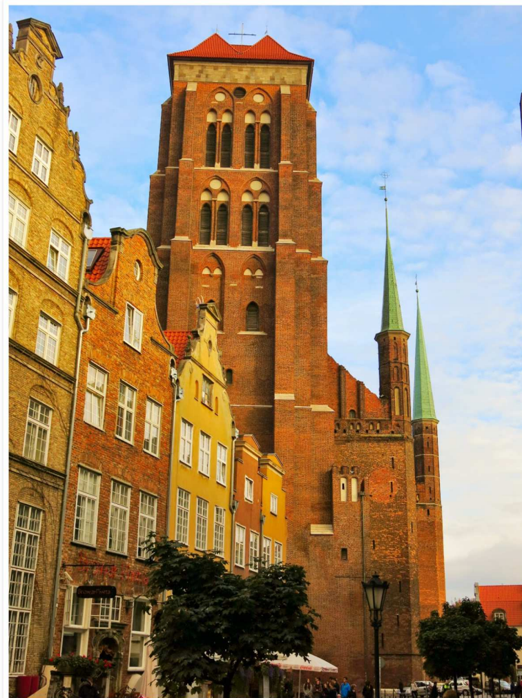
Gatan Pinwa och Mariakyrkans torn i bakgrunden. Den tredje bilden i detta inlägget är fotat från tornets tak