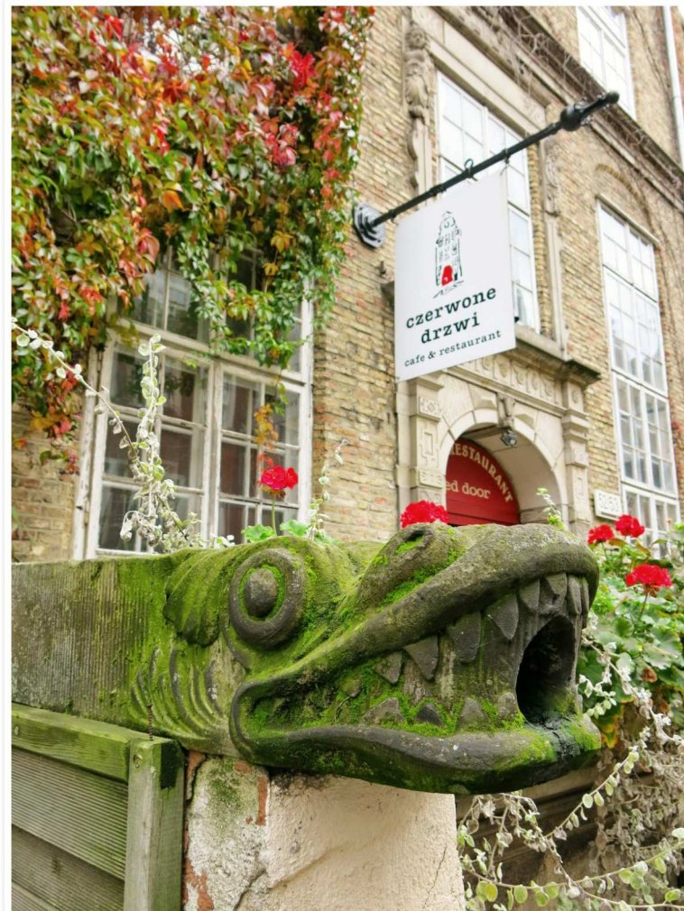
Dessa snygga vattenledare finns lite överallt i Gdansk